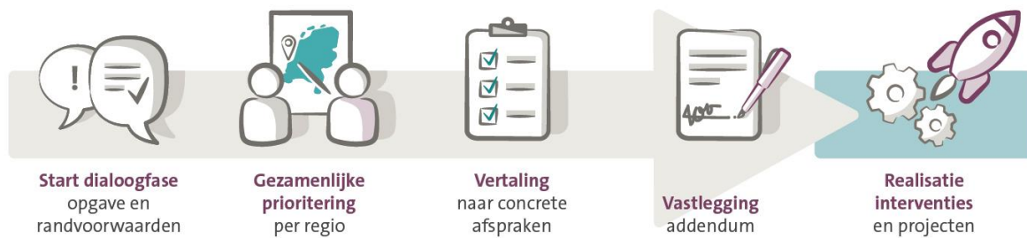
Figuur 1: Regiotafel – werkwijze in fasen